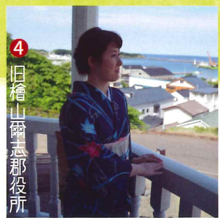
4 旧檜山爾志郡役所