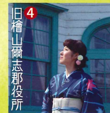
4 旧檜山爾志郡役所