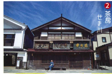
2 茶房 せき川