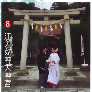
8 江差 姥神大神宮