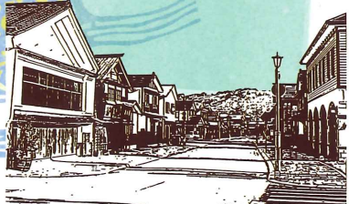
江差町歴まち商店街