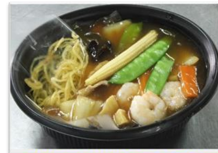
あんかけ焼きそば ¥760