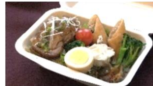
中華ランチボックス