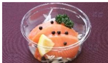
スモークサーモン ¥250