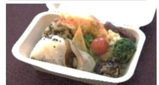
和食ランチボックス

週により内容が和・洋・中と変わります。例えば 1週目(洋食)・2週目(和食) 3週目(中華)の様に。 詳細はお問い合わせください 3月1日の週は洋食から始めます