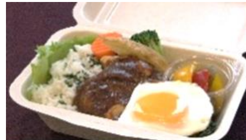
洋食ランチボックス