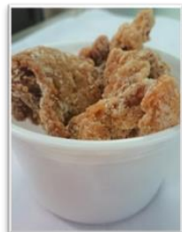
鶏揚げ 5ヶ入れ ¥300