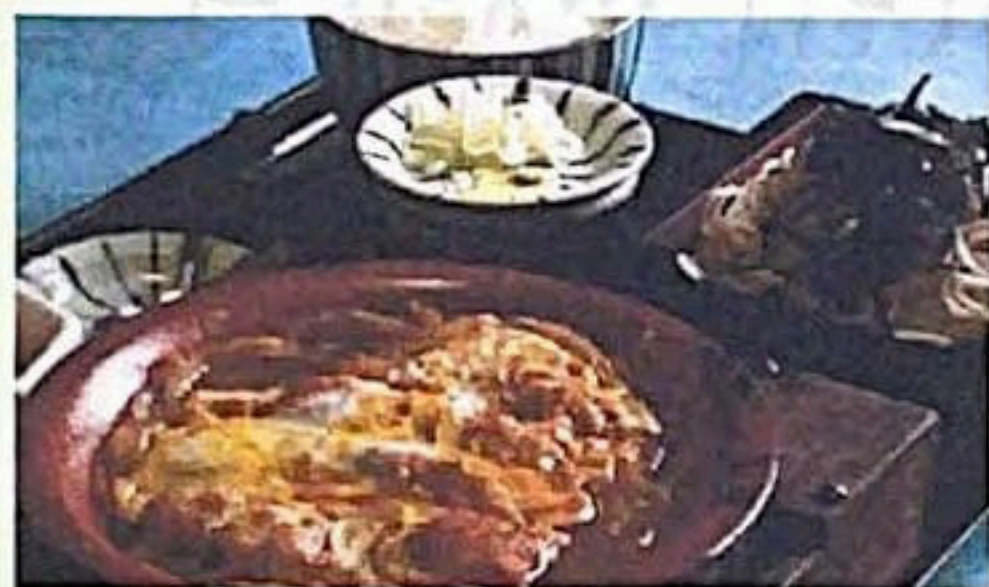
ミニカツ丼セット