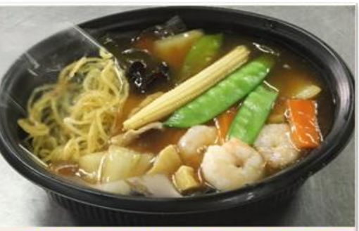
あんかけ焼きそば ¥760