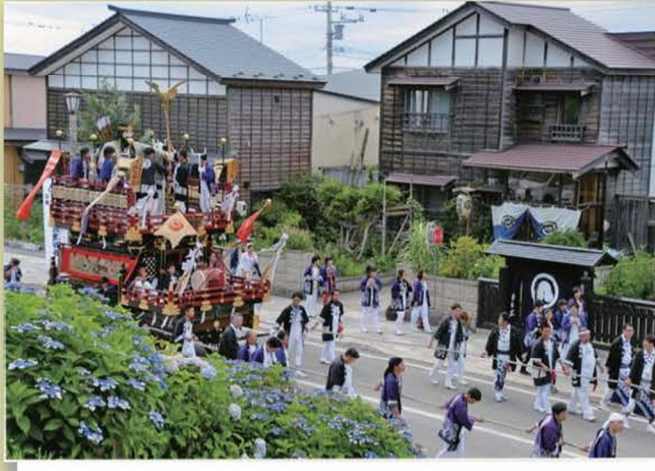
作品名「優雅な巡行」 撮影者 東 博昭 (函館市)