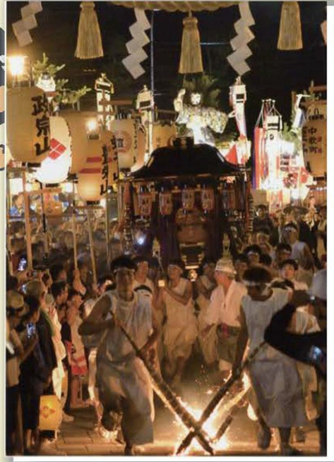
作品名「クライマックス」