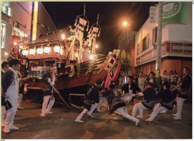
作品名「力の限り、引く!」