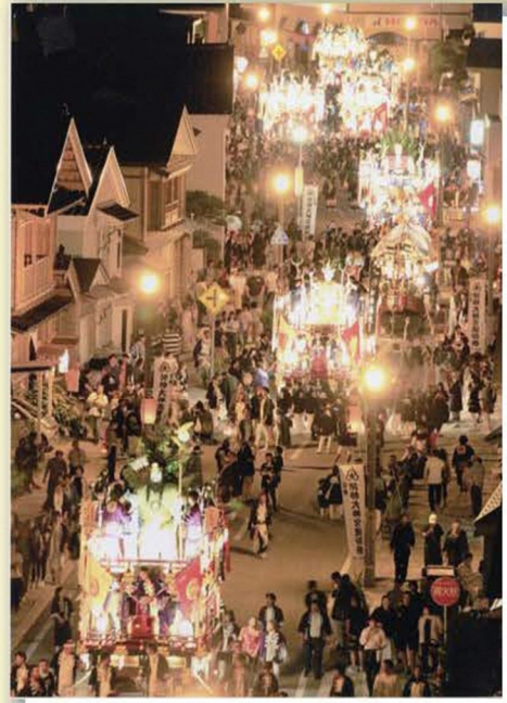
作品名「祭のきらめき」