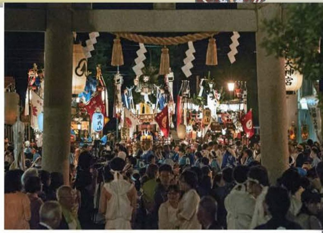
作品名「これが江差の祭だよ」