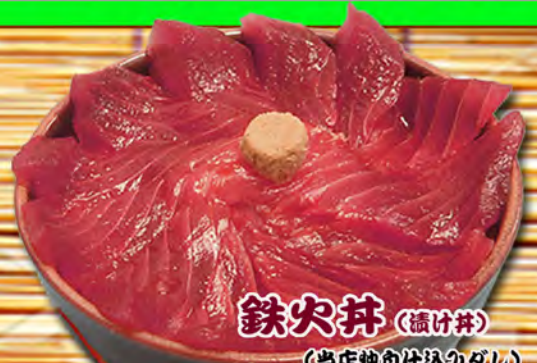
鉄火丼 (續け丼) (当店独自のは込みダレ)