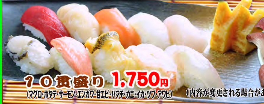
20貫盛り 1,750円 (マグロ・ホタテ・サーモン・エンガワ・甘エビ・ハマチ・カニ・イカ・ツブ・アワビ) (内容が変更される場合があります)