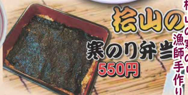
松山の寒のり 漁師手作り 松山の寒のり 寒のり弁当 550円