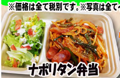
ナポリタン弁当 550円