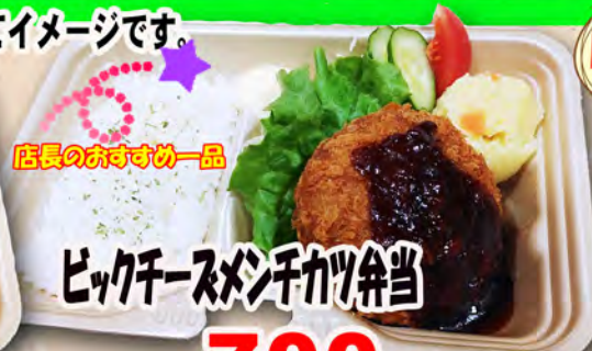
店長のおすすめ一品 ピクチーメンチカツ弁当 700円