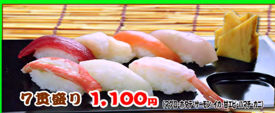
7貫盛り 1,100円 (マグロ・ホタテ・サーモン・イカ・甘エビ・ハマチ・カニ)