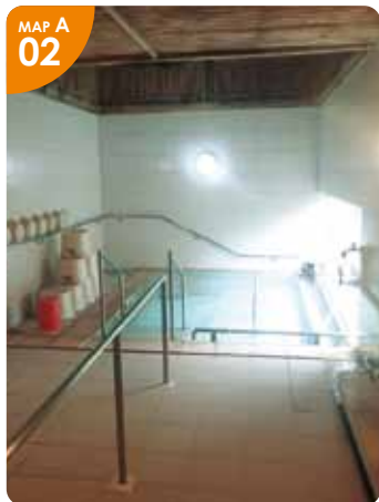
▲松などがある中庭を眺めながら、体も心も癒される温泉です。

江差町字田沢町82-7 ☎0139-54-5454 17:00～22:00（土・日は12:00～） 入浴料／障がい者と65歳以上150円、 大人300円、小人（6～12歳未満）120円、 幼児（3～6歳未満）100円 無休 P有