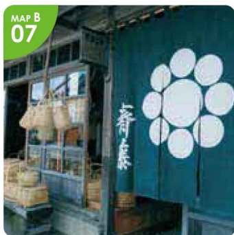
▲竹籠の他にも江差の絵ハガキやめずらしい商品なども販売しておりますので、是非お立ち寄りください。

●関川商店● 江差町字姥神町22 ☎0139-52-3969 8:00～19:00 日曜定休 P有