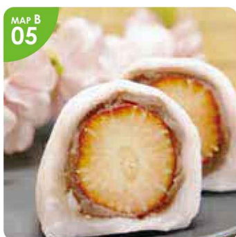
▲午前中で売り切れてしまうことも多い「莓大福(1個税込220円)」。購入はお早めに。

●藤谷漁業部● 江差町字津花町36番地 ☎0139-52-6818 9:00～17:00 不定休 P有