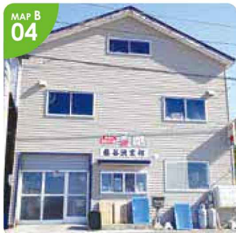
▲かもめ島入口前の国道沿い「まりちゃん」の看板が目印。