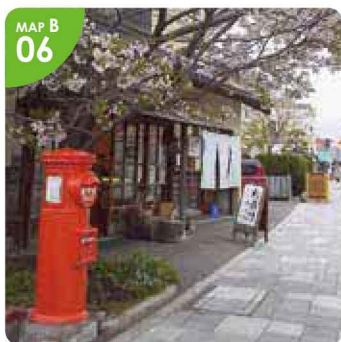
▲季節の海産物のほか、オリジナル商品の「江差かもめ島手焼きせんべい」が人気。

●山田屋菓子舗● 江差町字姥神町79-1 ☎0139-52-0302 8:30～18:00 日曜定休 P有