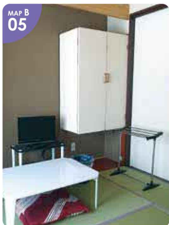
MAP B 05 ▲国道沿いに佇み、フェリーターミナルや中心地にも近いため、利便性にも優れています。

●ホテル寺子屋● 江差町字姥神町26-3 ☎0139-52-0855 チェックイン/15:00 チェックアウト/10:00 素泊まり7,500円(税込) 無休 P有