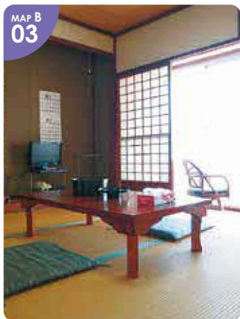
MAP B 03 ▲8畳の和室。窓からは海が一望でき、ロケーションが自慢のお部屋です。