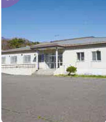
▲二段ベッドを備え付けた洋室のお部屋は、1部屋5名宿泊可能です(全10室)。