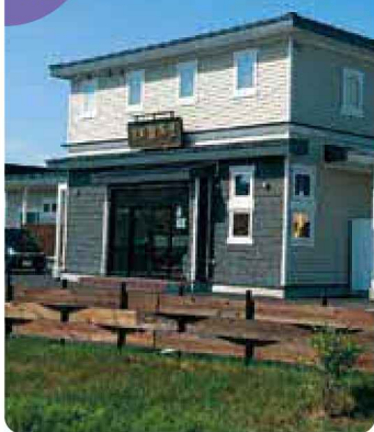
▲1泊素泊まりお一人様5,500円(税込)