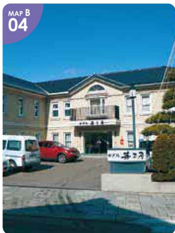
MAP B 04 ▲夕食は江差町で。提携先飲食店でご利用可能な「生ビール無料券(お一人様1枚まで)」を進呈します。

●辻旅館● 江差町字中歌町56 ☎0139-52-0062 チェックイン/16:00 チェックアウト/10:00 1泊2食付7,150円(税込)～ 12月29日～1月3日のみ 休館 P有