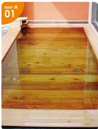
▲露天風呂の浴槽には、江差産檜を使っています。