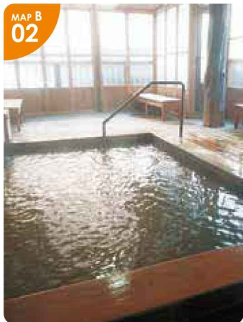
▲内風呂の奥にある露天風呂。温泉は源泉100%かけ流しです。

江差町字田沢町82-7 ☎0139-54-5454 17:00～21:00 (土日は12:00～) 入浴料/障がい者と65歳以上150円、 大人300円、小人(6～12歳未満)120円、 幼児(3～6歳未満)100円 無休 P有