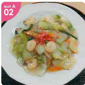
MAP A 02 ▲飽きずにどんどん箸がすすんでしまう「あんかけ焼そば(税込600円)」は熱々。