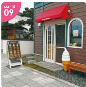
▲小林牛乳を使用しておやきもあり、散策時のお供にぴったり。