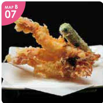
▲「ガサ海老の天ぷら(税込670円)」