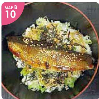
▲江差の名物である「にしん」を使った「にしん井(900円)」