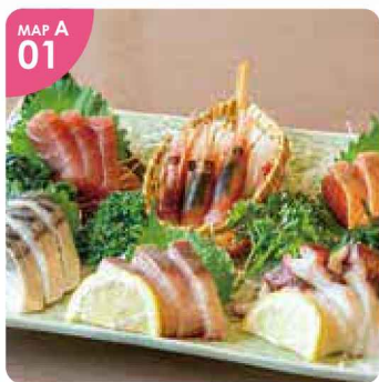
MAP A 01 ▲3~4人前となる「刺身盛合せ(税込2,178円)」。季節により内容は変わります。