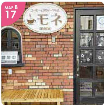
▲コーヒーとスイーツでつろぎのひと時をお過ごしください。