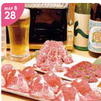
MAP B 28 ▲綺麗に盛り付けられたお肉はどれも絶品!