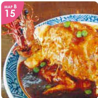
▲江差の地鶏のふわふわ卵で包んだ「車海老フライとオムライス(税込1,700円)」。