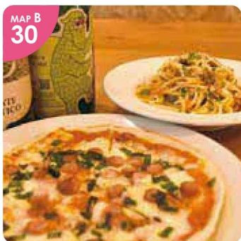
MAP B 30 ▲上ノ国産のフルーツポークを赤ワインとトマトで煮込んだソースの Pasta「フルーツポークのラグー(税込980円)」