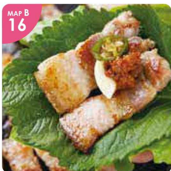
▲サムギョプサルは、ヘルシーで野菜をたくさん食べれるとリピーターが多い人気のメニューです。