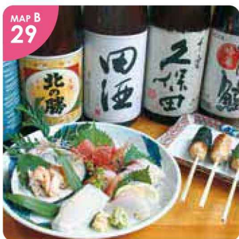
MAP B 29 ▲鮮度抜群の季節の素材を活かした料理とお酒をご堪能ください。