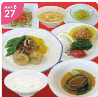
MAP B 27 ▲セットメニューの中で人気が高い「中華セット(税込2,200円)」。ボリュームも満点です。