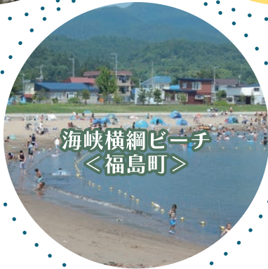
海峡横綱ビーチ ＜福島町＞