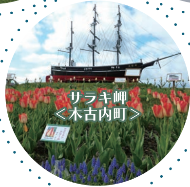
サラキ岬 ＜木古内町＞