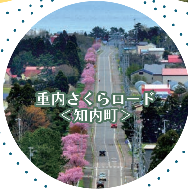
重内さくらロード ＜知内町＞