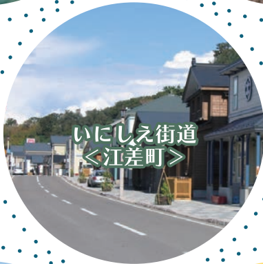
いにしえ街道 ＜江差町＞