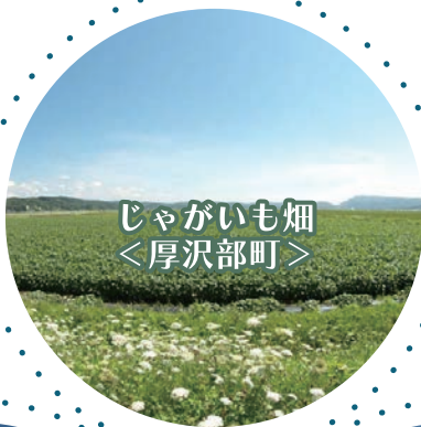
じゃがいも畑 ＜厚沢部町＞