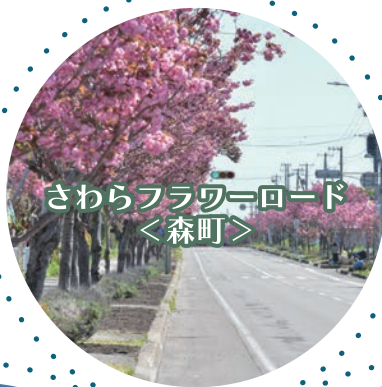
さわらフラワーロード ＜森町＞