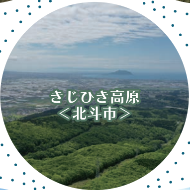
きじひき高原 ＜北斗市＞