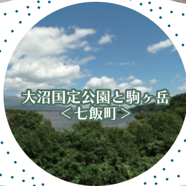
大沼国定公園と駒ヶ岳 ＜七飯町＞