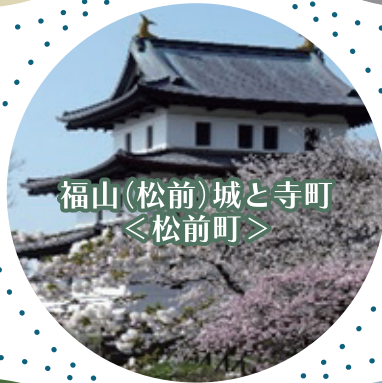
福山(松前)城と寺町 ＜松前町＞