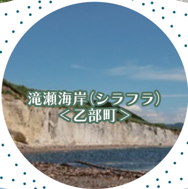
滝瀬海岸(シラフラ) ＜乙部町＞