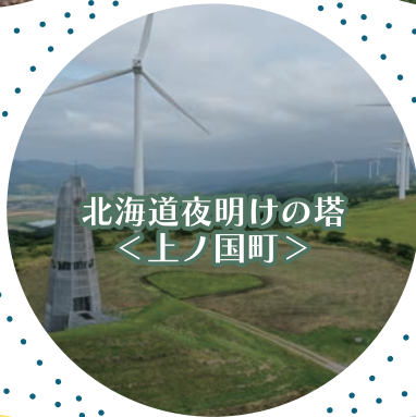
北海道夜明けの塔 ＜上ノ国町＞