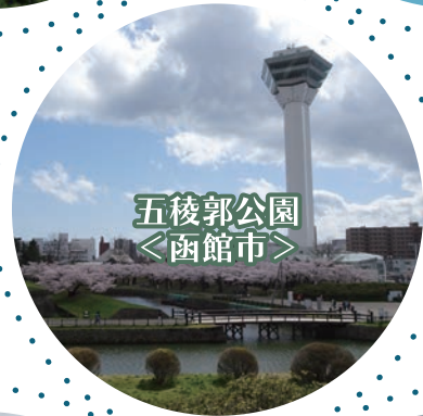
五稜郭公園 ＜函館市＞