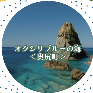
オクシリブルーの海 ＜奥尻町＞