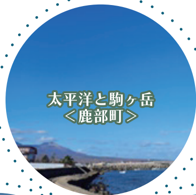
太平洋と駒ヶ岳 ＜鹿部町＞