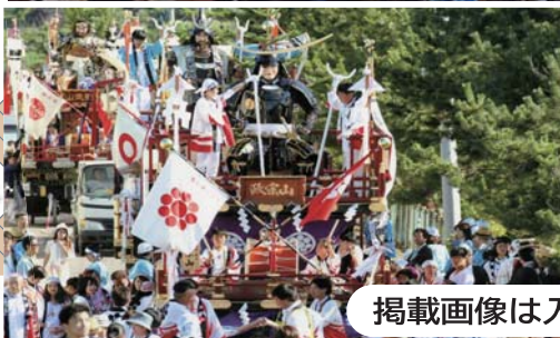
掲載画像は入選作品より