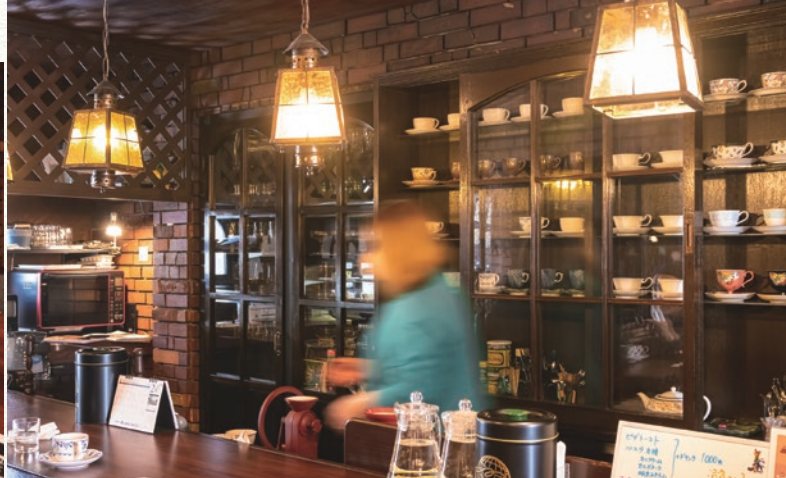
広いカウンター席では気さくなスタッフが声を掛けてくれるので、一人の来店でも居心地よく過ごせます。