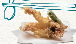
「ガサ海老の天ぷら」

ここでしか味わえない地域の食材を活用し、 独自に研究したレシピで和食・洋食に仕立てます。