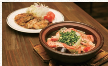
酒の肴になる単品料理も、和食・洋食 と充実しています。

お酒を飲みながら地元食材を 使用した料理が楽しめるレス トラン。「お刺身」や「天ぷら」 などのスタンダードな和食に 加え、身近にある食材を時間 をかけて造る創作料理を得意 とし、コース又は単品でお楽 しみ頂けます。また、レシピ 研究を重ねたクリームコロツ ケ、エビフライ、グラタンな どの洋食や、食後のスイーツ メニューが人気急上昇中です。 客席ホールはパーティショ ンを移動することで、パー ティーや宴会に対応します。