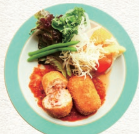
洋食メニューの「江差産カニコロッケ」は、 食事メインの方やお子さんにオススメです。

ここでしか味わえない地域の食材を活用し、 独自に研究したレシピで和食・洋食に仕立てます。