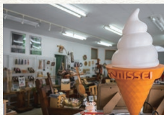
同じ店内には木工作品の店があります。

創業90年の老舗牛乳屋さん が営むソフトクリームとおや きの店。小林牛乳を使用した ソフトクリームはしぼりたて の牛乳に近い味わいです。数 量限定の手焼きコーンとの組 合せがオススメです。 おやきは当店で手作りする 特製カスタードクリームが絶 品。期間限定の餡を含めて3 〜4種類を販売しています。 また、4月や9月頃には期 間限定のオリジナルパフェが 登場します。ソフトクリーム とはまた違う味わいをお楽し み下さい。