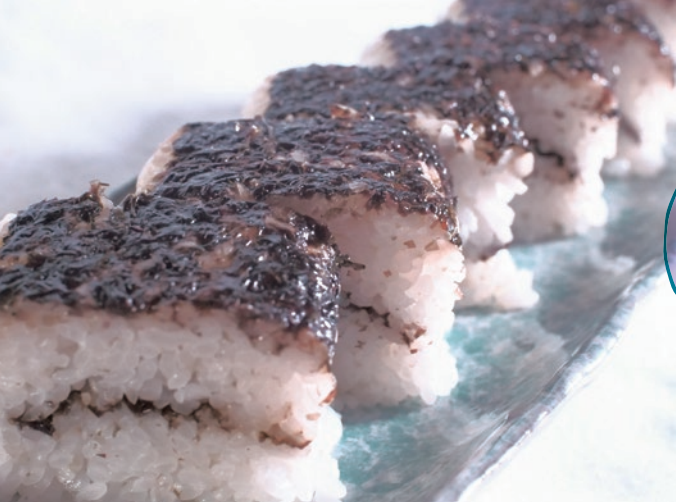
希少な檜山産の天然岩海苔を使用した風味豊かな「天然岩海苔の棒めし」。