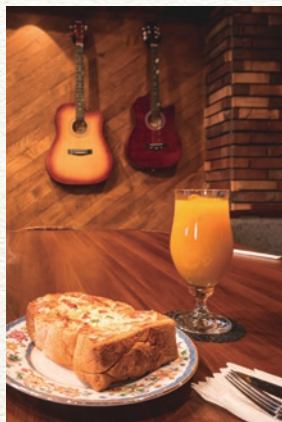
厚切りパンの「ピザトースト」。