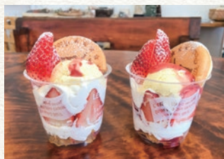
春限定で登場する苺を使ったパフェ。

創業90年の老舗牛乳屋さん が営むソフトクリームとおや きの店。小林牛乳を使用した ソフトクリームはしぼりたて の牛乳に近い味わいです。数 量限定の手焼きコーンとの組 合せがオススメです。 おやきは当店で手作りする 特製カスタードクリームが絶 品。期間限定の餡を含めて3 〜4種類を販売しています。 また、4月や9月頃には期 間限定のオリジナルパフェが 登場します。ソフトクリーム とはまた違う味わいをお楽し み下さい。