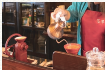
丁寧に淹れてくれる珈琲を待つ時間も楽しい。ゆったりと時間が流れます。

昨年閉店した喫茶店の跡に、商店街の灯りを消さないようにと店名を改めて新規開店しました。今では数少ない昔ながらの純喫茶の形態を継承しています。 珈琲は注文を受けてから豆を挽いてドリップしています。飲み物のほか、ケーキやアイスクリーム等のデザート、ピザトーストやパスタなどの軽食があります。また、ビールもご用意しています。