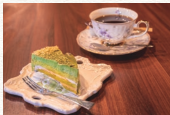
店先のショーケースにはケーキが並んでいます。お持ち帰りもできます。