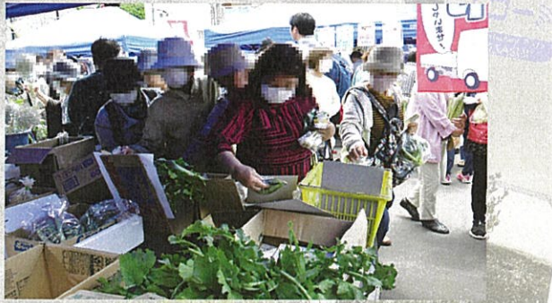
令和6年度江差町地域産品営業プロモーション事業