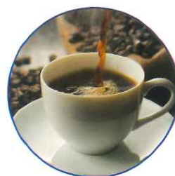
十字屋コーヒー 500円