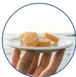
じゃがいも羊羹 400円