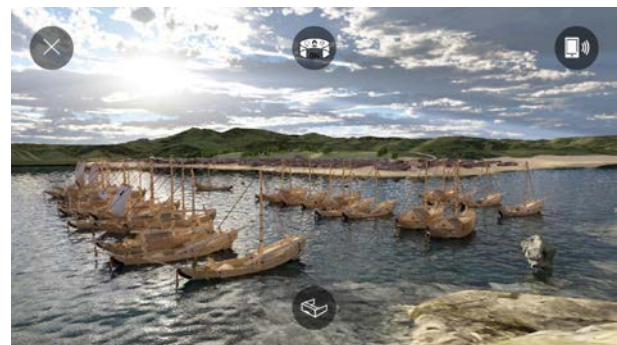
VRコンテンツ『江差の五月』より、いこしえ街道(左上)、法華寺(右上)、新地町(左下)、かもめ島のイメージ(右下)、 製作・著作:江差町 制作:凸版印刷株式会社